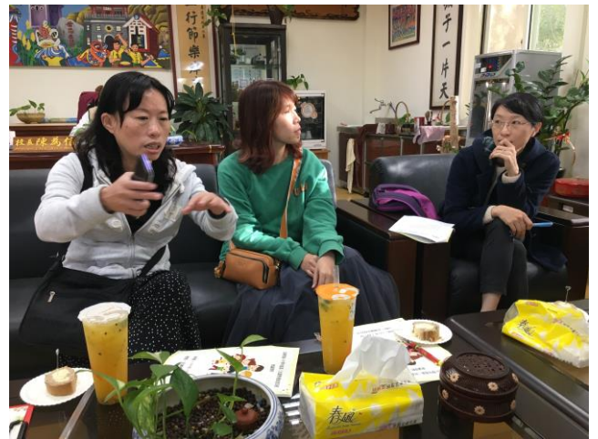
課程計畫修訂說明