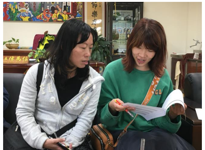
湖區週三進修共同規劃