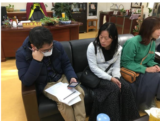
確認後續年度彙整學校