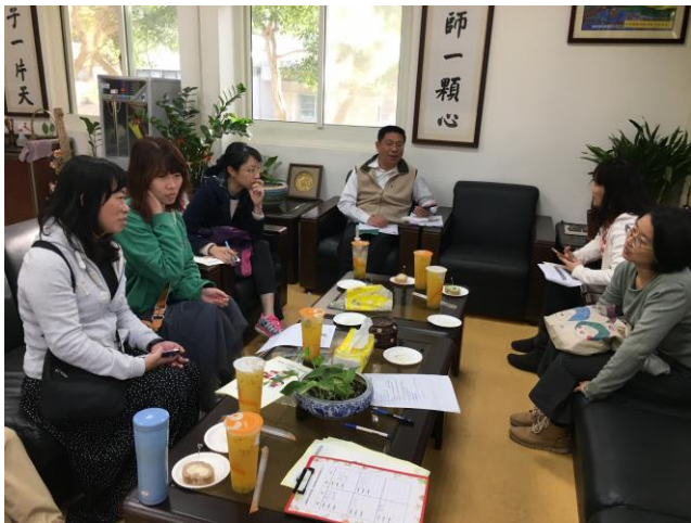
開場說明會議題綱