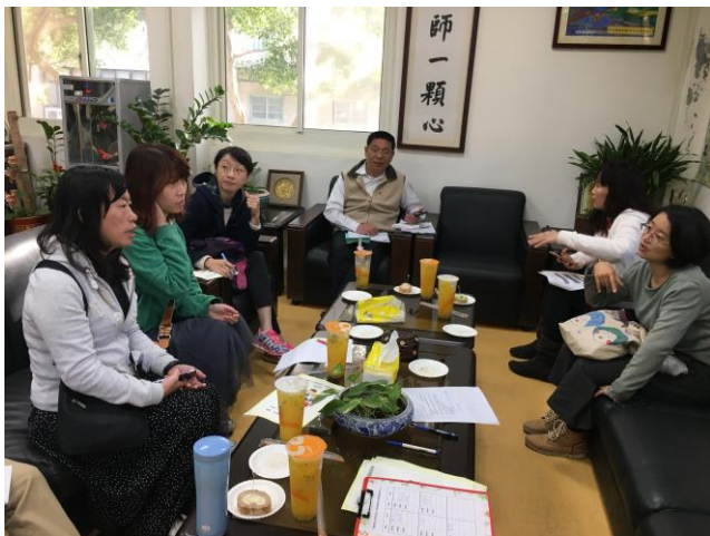
決議學校本位課程安排